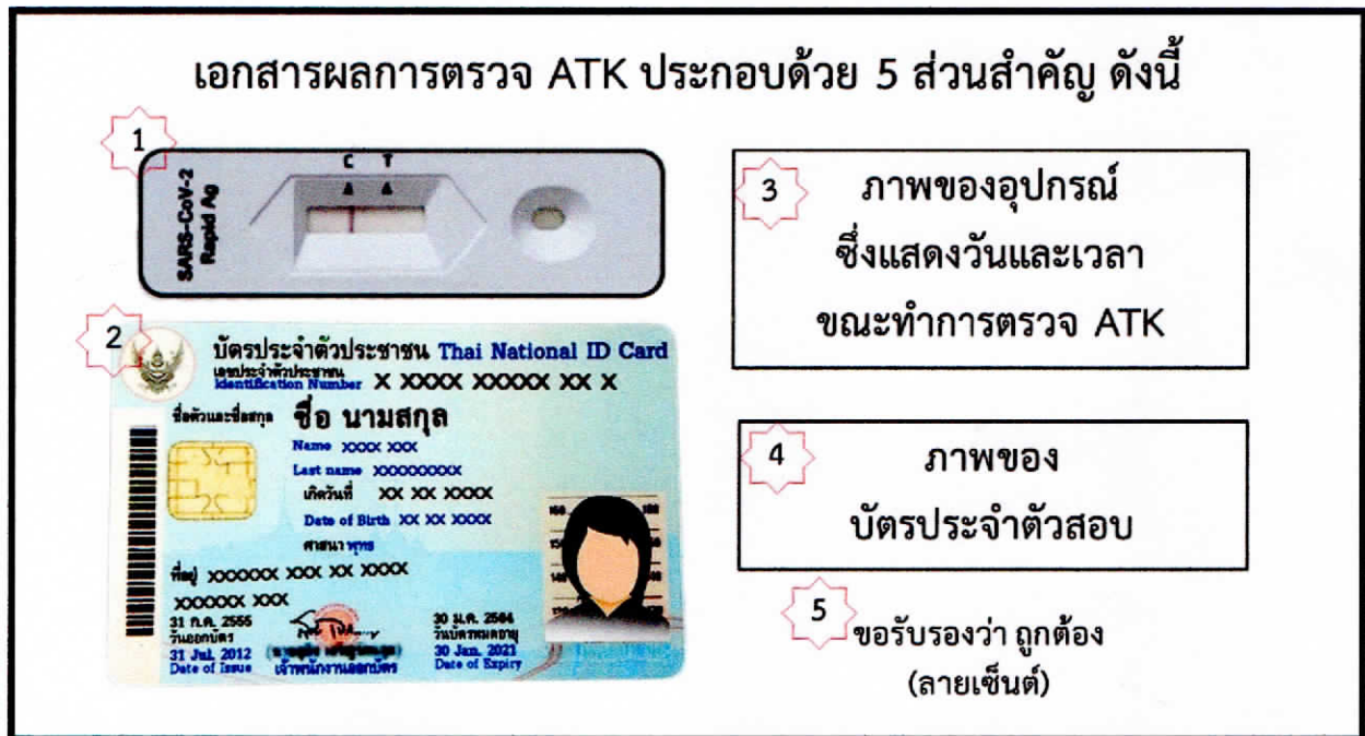
ภาพที่ 1 เอกสารผลการตรวจ ATK (โปรดพิมพ์ลงบนกระดาษ A4 ตามที่กำหนด)

2.1 ผู้สอบผ่านภาควิชาการ จะต้องเข้ารายงานตัว ที่โรงเรียนนายเรือ ในวันพฤหัสบดีที่ 18 เม.ย.67 โดยจะต้องตรวจคัดกรองเชื้อไวรัสโคโรนา ๒๐๑๙ (Covid-19) ด้วยการตรวจแบบ Antigen Test Kit (ATK) ได้ตั้งแต่วันที่ 17 เม.ย.67 เวลา 08.00 น. เป็นต้นไป และพิมพ์เอกสารผลการตรวจ ATK ลงบนกระดาษ A4 (รูปแบบของเอกสารที่พิมพ์เป็นไปตามภาพที่ 1 เอกสารผลการตรวจ ATK) แล้วนำเอกสารผลการตรวจ ATK มาแสดงต่อคณะกรรมการสอบคัดเลือกฯ ในวันพฤหัสบดีที่ 18 เม.ย.67