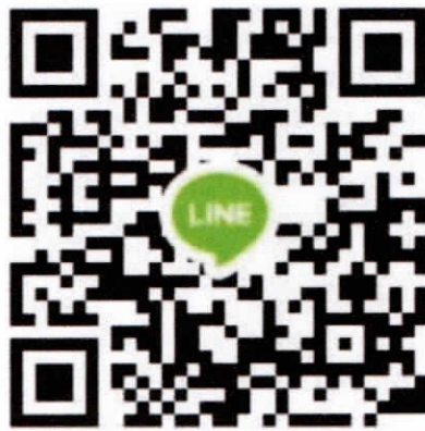
ภาพที่ 2 : QR-Code กลุ่มไลน์ “ผลตรวจ ATK นตท.(ทร.) 67”

6.3 เมื่อตรวจ ATK เรียบร้อยแล้ว ให้ถ่ายภาพ “ผลการตรวจ ATK” ตามรูปแบบ เช่นเดียวกับ ภาพที่ 1 ในข้อ 2.1 แล้วส่งภาพถ่ายดังกล่าว เข้ากลุ่มไลน์ “ผลตรวจ ATK นตท.(ทร.) 67” ภายในเวลา 17.00 น. ของวันที่ตรวจ ATK โดยสามารถ add เข้ากลุ่มไลน์ดังกล่าวได้ตาม QR-Code ข้างล่างนี้